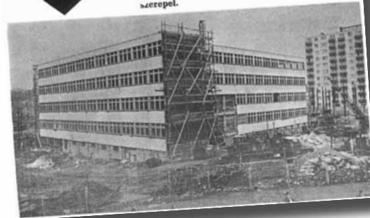
Megjelent a Kelet-Magyarország 1976. április 4.-i számában