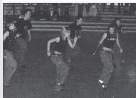
...valamint az Y2K"