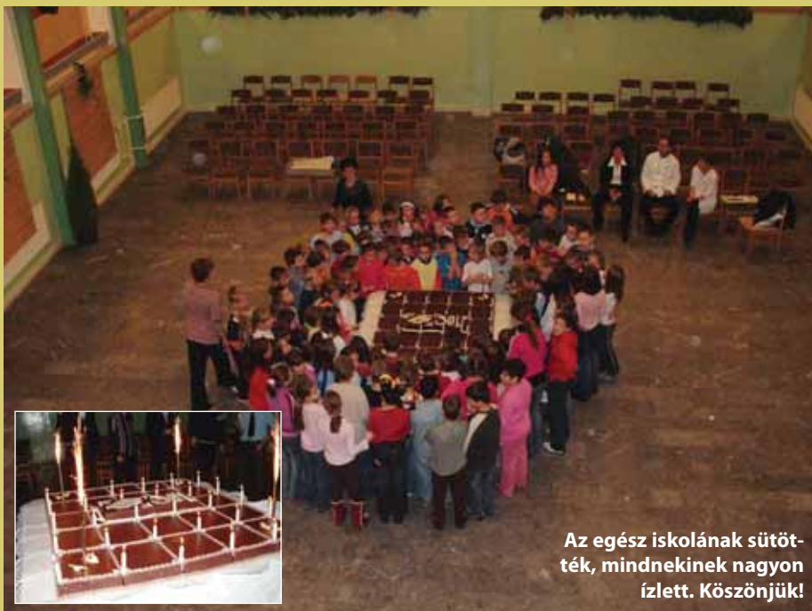
Az egész iskolának sütöt- ték, mindnekinek nagyon ízlett. Köszönjük!

Bár a 8. oldalon képekkel is illusztrálva tudósítunk alapító tanáraink elismeréséről, azért itt is elmondjuk, hogy kik azok, akik az első perctől az Arany tanári karának alapítói voltak: