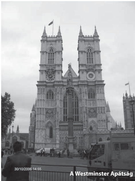
A Westminster Apátság

Egy Hatvani csoporttal összevonva látogattuk meg London városát. Összesen 45 fővel indultunk a nagy útnak. Az első két órában próbáltunk össze ismerkedni a Hatvani csapattal, nagy sikerrel. Az ismerkedés folyamán olyan poénok hangoztak el, ami szerintem a csapat számára egy feledhetetlen élmény marad. A buszon alvást megpróbáltuk minél kényelmesebbé tenni, de szerintem a lábzsibbadást senki sem kerülhette el! Brüsszelben megálltunk egy városnézésre. Második este egy forma 1-es szállóban, Franciaországban aludtunk, ami közel volt a Csalagúthoz. Másnap dél körül már Angliában voltunk. De aznap még a városban és külvárosokban nézelődtünk, majd csak este vittek el minket a családokhoz ahol egész hétre szállást kaptunk! Meglátogattuk a vízzel körülvett Leeds Kastélyt És Canterbury-t a közép-