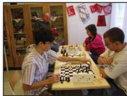
Az elme bajnokai