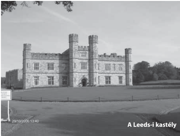
A Leeds-i kastély

A vonatunk 2 órakor indult az állomásról. Előtte szüleinktől érzékeny búcsút vettünk és elindultunk Budapestre ahol már a busz várt minket.