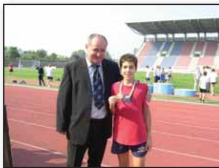
Joggal büszke igazgató