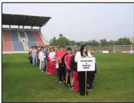
A győztes csapat

Ebben a tanévben iskolánk rendezte meg a nyolcosztályos gimnáziumok megmérettetését. A sportrészén már túl is vagyunk. Kell-e mondanunk, hogy társaink ismét bebizonyították, hogy nagyon fel kell kötnie annak az iskolának azt a bizonyost, ha a babérjainkra kíván törni.