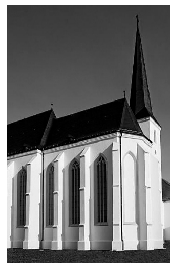
A minorita templom

NYÍRBÁTOR. A Debrecen-nyíregyházi egyházmegye Ifjúsági Irodája szervezésében április 11-én, szombaton egyházmegyei ifjúsági találkozót szerveznek Nyírbátorban. A találkozó témája: Párkapcsolat, Szexualitás, Házasság. A résztvevők a minorita templomban regisztrálnak (Károlyi u. 19.), majd az Ifjúság útja 2. szám alatti helyiségben hallgatják meg az előadásokat. A program táncszállal és püspöki szentmisével zárul - tudatta Gerhes József. KM