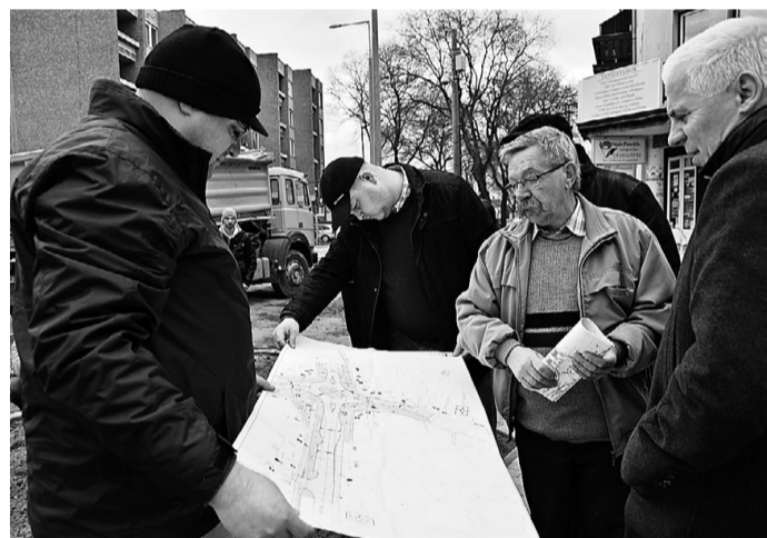
Jó útemben épül a Szarvas utcai körforgalom

NYÍREGYHÁZA. A Móricz Zsigmond Színház is készül a költészet napjára: április 11-én, szombaton 19 órától két podiumestre - Legyen világosság! címmel Pregitzer Fruzsina önálló estjére, és az Ahol megérint a szél című zenés lírai performanszra - várják az érdeklődőket a Krúdy kamarába.