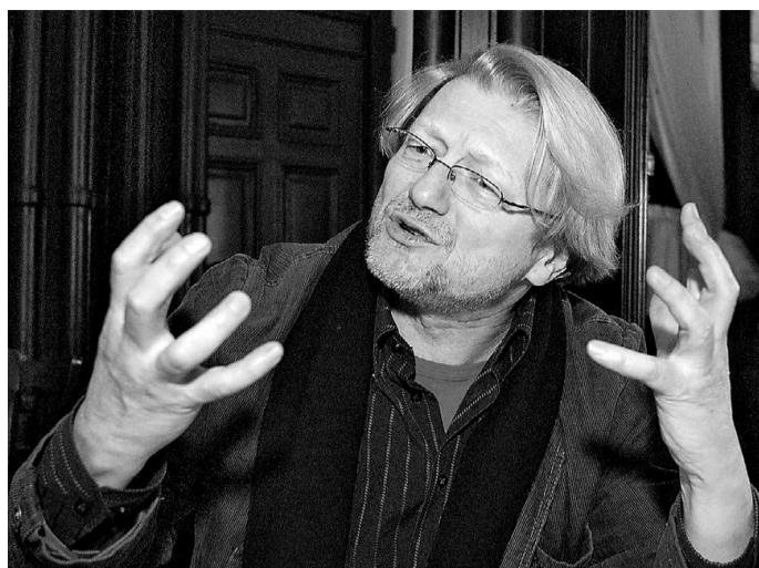
Hegedűs D. Géza körül mindig vibrál a levegő

IBRÁNY. Hegedűs D. Gézának ítelték az idén a Gábor Miklós-díjat a Vígyszínház Julius Caesar című előadásának címszerepében nyújtott alakításáért. Az ibrányi születésű, Kossuth- és Jászai Mari-díjas színész, rendező, egyetemi docens, a Színház- és Filmművészeti Egyetem rektorhelyettese, a MASZK Országos Színészegyesület elnöke újabb jeles elismeréssel gazdagodott. Édesapja Ibrányban volt pedagógus és később a művelődési ház igazgatója. KM